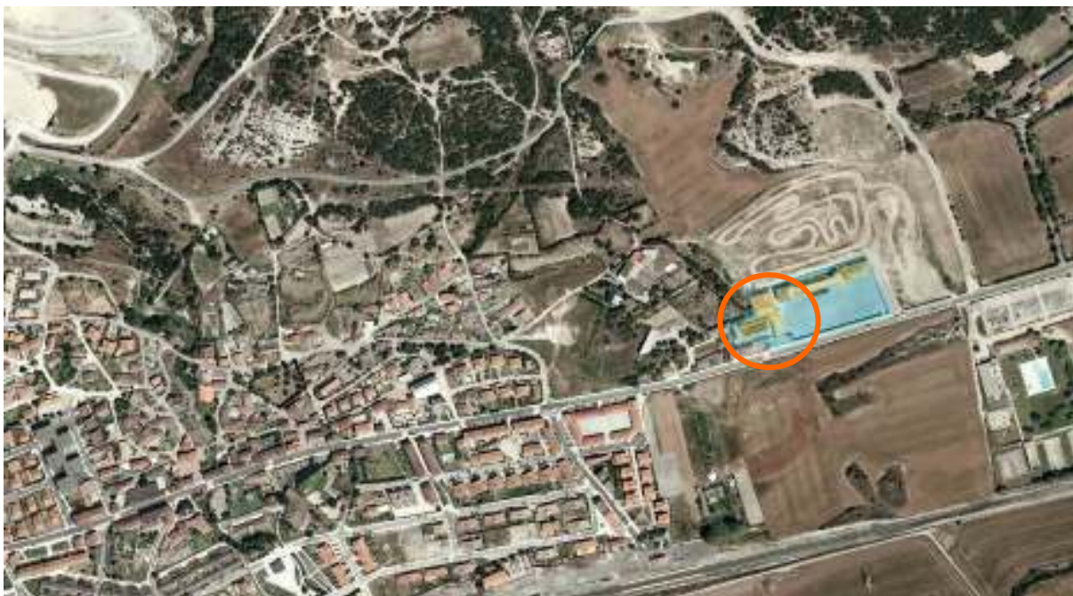
Imagen 1: Localización.

Como se muestra en la imagen 1, la parcela en cuestión, con referencia en el Catastro 26-2-540, se localiza en al este del núcleo urbano tradicional de Nanclares de la Oca, próxima a la zona deportiva de Arrate.