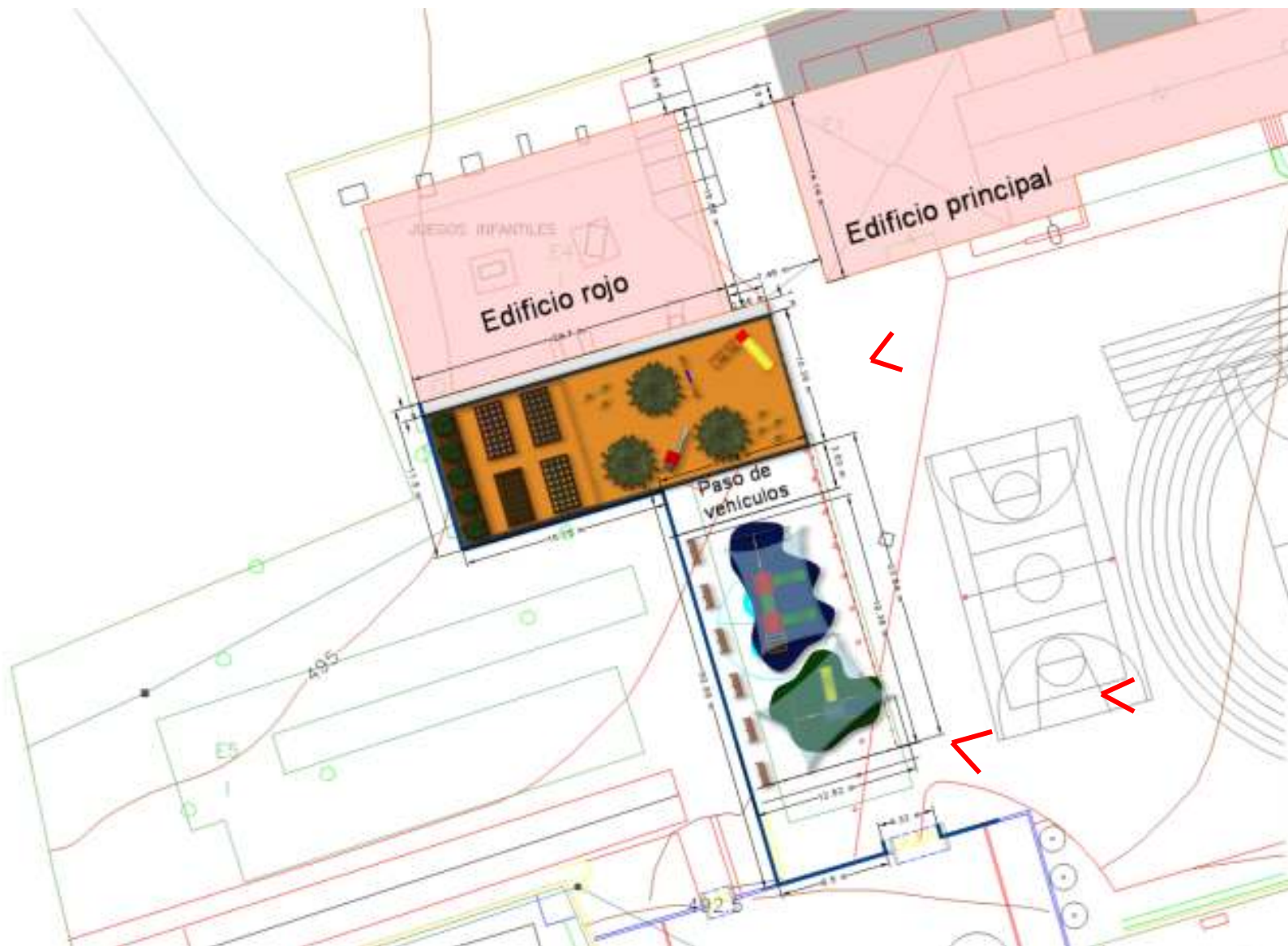
Imagen 1: Planta general

Se adjuntan algunas imágenes de la propuesta orientativa elaborada desde el Ayuntamiento. No se trata en ningún de caso de una propuesta vinculante.