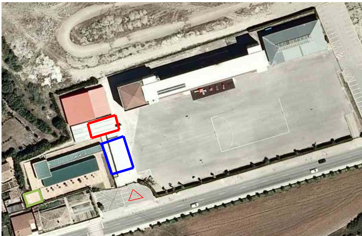
Imagen 3: Emplazamiento.